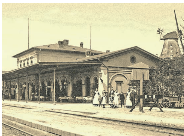
Hinter dem Eutiner Bahnhof prunkt die Windmühle Moder Grau auf dem Hügel. Vor dem einladenden Bahnhofslokal präsentiert man sich mit Groß und Klein.

Dort hätte die Strecke eigentlich verlaufen müssen.