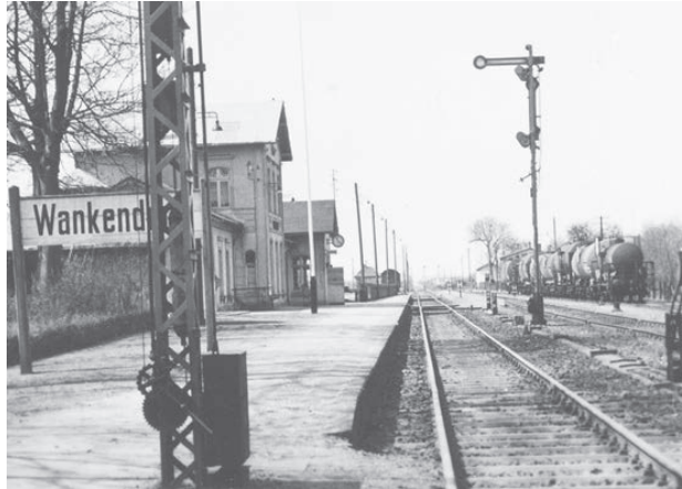
Ein sonniger Tag im Frühjahr 1956. Der Bahnhof von Wankendorf scheint um 11.20 Uhr wie leergefegt.

Der Boden bebt, als das tonnenschwere Ungetüm von Zug mit kreischenden Bremsen schließlich zum Stillstand kommt. So oder ähnlich hat es sich vor einem halben Jahrhundert noch zugetragen an den hiesigen Bahnhöfen – die Boomer erinnern sich -, ob in Eutin, Plön oder Wankendorf. Wankendorf? Volker Griese, Regionalforscher, Jahrbuchautor der AG Heimatkunde im Kreis Plön, und Wankendorfer Urgestein, hat sich die Geschichte der Gleise im heutigen Kreis Plön und Ostholstein nicht nur auf die