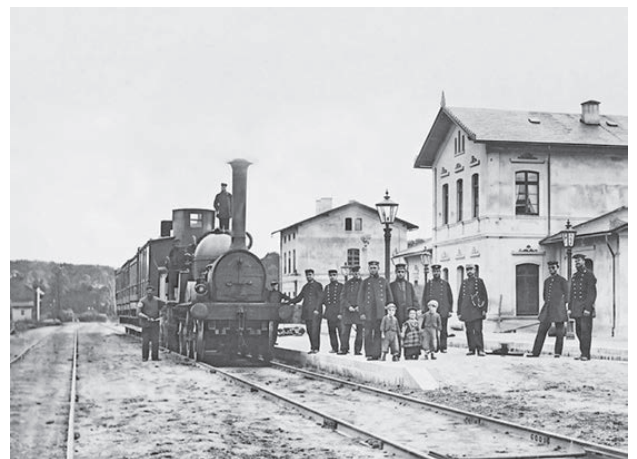
Stolz präsentiert man sich 1866 auf dem Bahnhof von Ascheberg.

Mit Kiel war Altona bereits seit 1844 durch eine Bahnlinie verbunden. „Danach sollte es mit dem Bahnbau gleich weitergehen“, verdeutlicht Volker Griese. Eine Gleisverbindung von der Elbe-Hafenstadt Glücksstadt um Hamburg herum nach Neustadt war zum Beispiel auch angedacht. Und 1845 kam die Planung einer Strecke von Neumünster nach Neustadt dazu. Sie war dann „das einzige realisierte Projekt“, so Griese. Aber eben erst gute zwei Jahrzehnte später. Durch den Deutsch-Dänischen Krieg 1864 änderten sich nun die Machtverhältnisse. Doch der Bahnbau schritt bis zur Eröffnung 1866 trotzdem weiter voran. Die neue Verbindung im Hol-