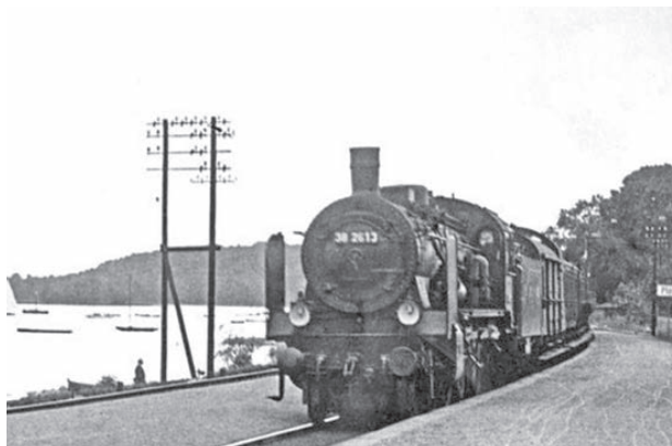
1932 hält ein Zug auf dem Weg nach Lübeck am Plöner Bahnhof, dessen Gleisbetten direkt am Seeufer verlaufen.