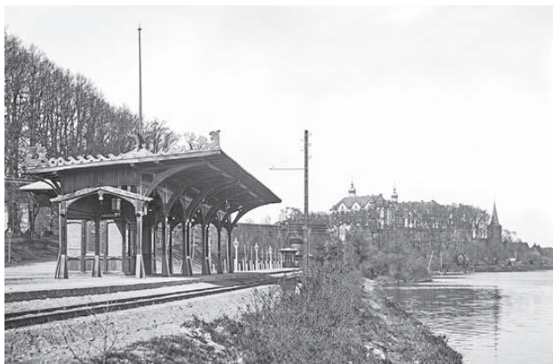
Die Parkstation im Plöner Schlosspark wurde eigens für die Hohenzollern errichtet, da die Prinzen hier zur Schule gingen.

steinischen hätte man überall groß feiern wollen. „Aber die Altona-Kieler Eisenbahngesellschaft wollte das nicht“, sagt Volker Griese mit Blick auf den anschließenden Deutsch-Deutschen Krieg 1866, „weil die Zeiten nicht zum Feiern waren.“ Die Gesellschaft habe durch den bewussten Verzicht aufs Feiern ein Zeichen setzen wollen, dass der Deutsch-Deutsche Bund zerfiel.